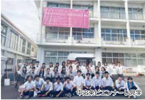
中之条ビエンナーレ見学