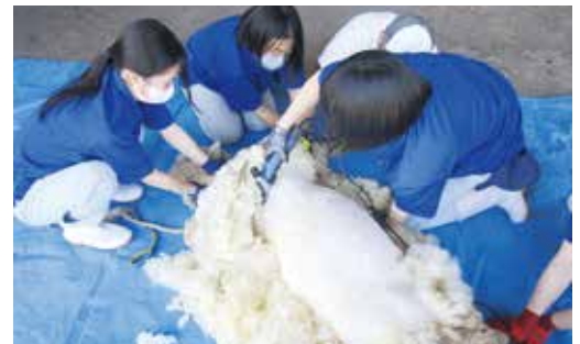
3年課題研究（ヒツジの毛刈り）