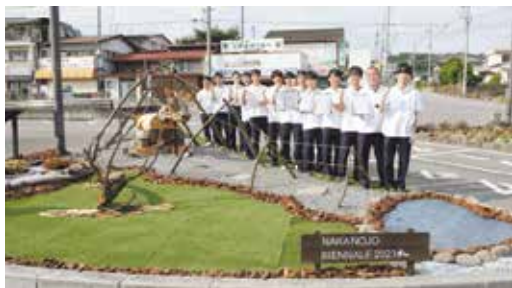
中之条駅前にアートの花壇を製作