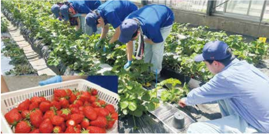
野菜専攻（イチゴ収穫）