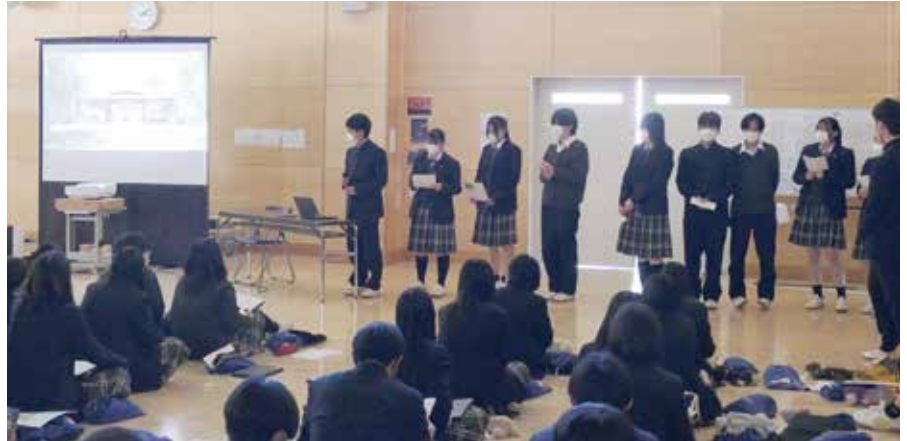
総合的な探究の時間 成果発表（2年生）