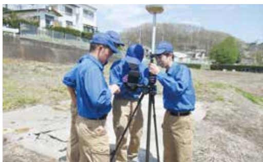
人工衛星を利用したN-RTK測量実習