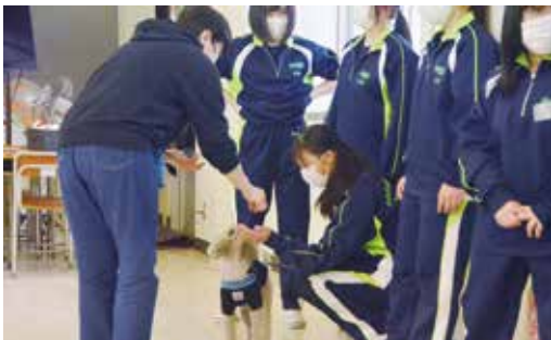
犬のしつけ教室（生物生産科との連携）