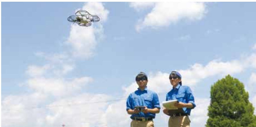
ドローンの飛行実習