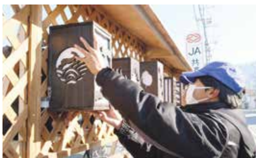
自作の行灯を街中に展示