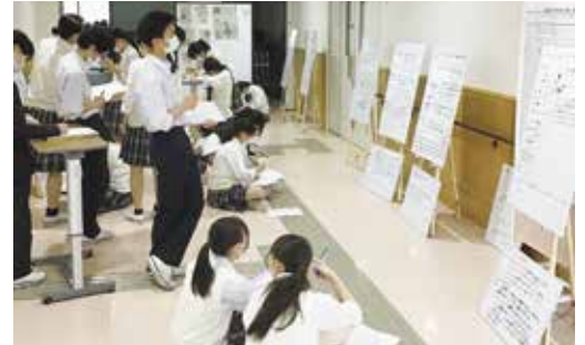
生徒主体の学習（介護過程）