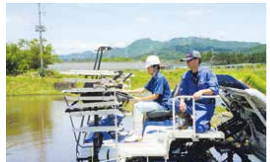
農業機械実習（田植え）