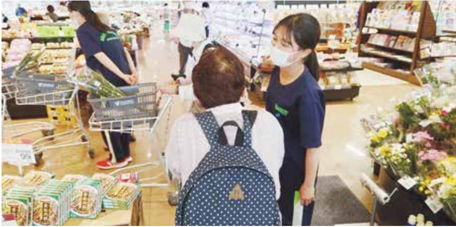
買い物支援ボランティア