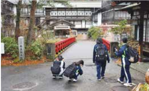
総合的な探究の時間 四万温泉視察（1年生）