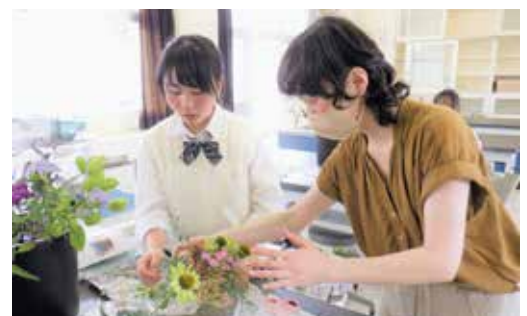
園芸専攻（フラワーアレンジメント）