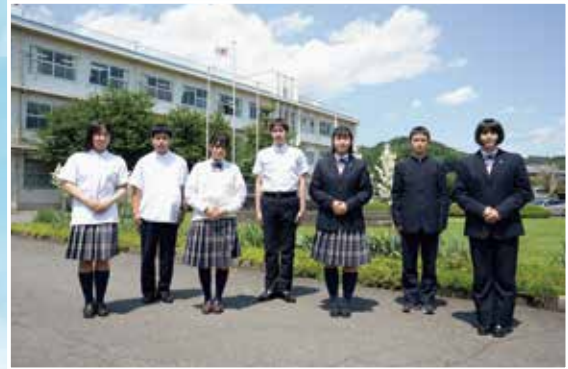
季節に合わせて快適に過ごせる制服