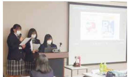
群馬県高校生福祉研究発表会