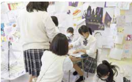
中之条ピエンナーレ 実地研修